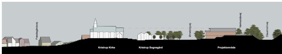
Illustration fra lokalplanens side 29

Der har været afholdt et teamsmøde med Randers Kommune den 3. juli 2024 hvor forslaget der nu er indarbejdet i lokalplanen blev drøftet. Inspektoratets anbefaling til kommunen i denne forbindelse var at bortkøre overskudsjord fra byggepladsen i stedet for at genindbygge den (forhøjer terræn) og at placere længebygningerne i en vifte således at udsynet fra kirken bibeholdtes mellem bygningerne og de ikke ville opleves så massive fra kirkebakken. Det bemærkes at disse anbefalinger ikke er søgt indarbejdet.